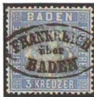
Köhler, Sammlung Boker